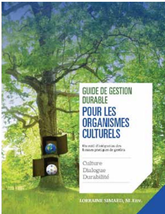
Guide de gestion durable pour les organismes du secteur culturel

Le Comité 21 Québec considère que la dimension culturelle vise, aussi, à servir le domaine minier pour lequel, initialement, les besoins de comprendre les enjeux culturels des populations locales sont nés.