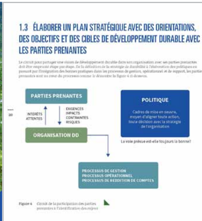
Circuit de la participation des parties prenantes dans le processus de gestion