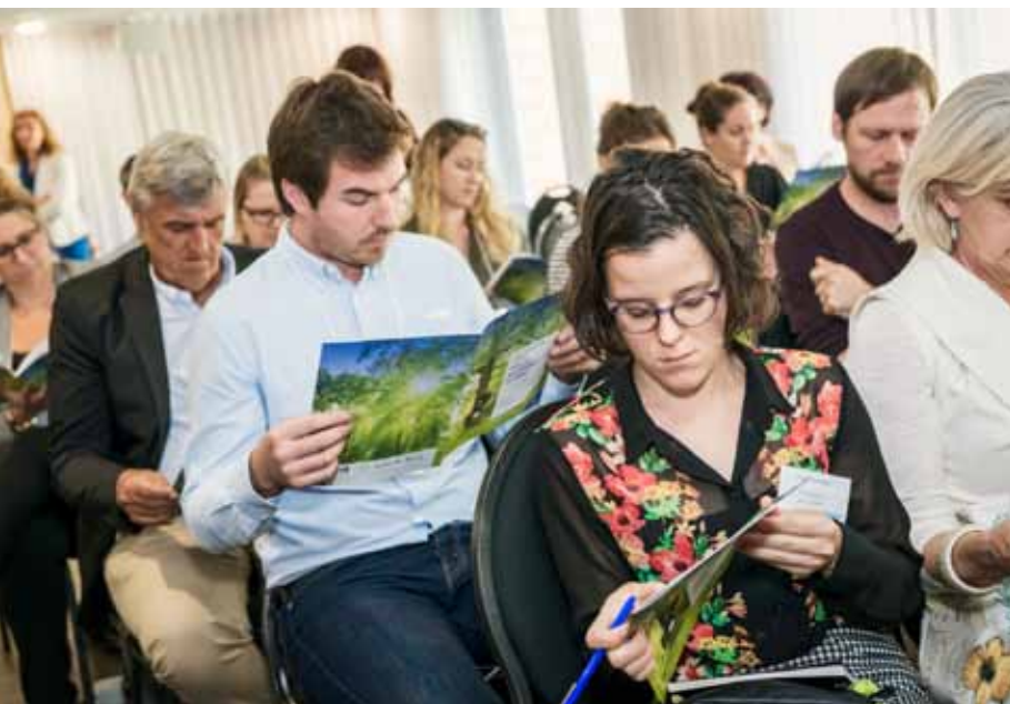
Présentation de la dimension culturelle du développement durable

“ Les rencontres 2018 ont permis de sensibiliser les dirigeants, les gestionnaires et les élus sur l'intégration des enjeux du développement durable dans leurs stratégies et leurs projets. Le Comité 21 Québec est fier de l'intérêt grandissant de ces leaders. ”